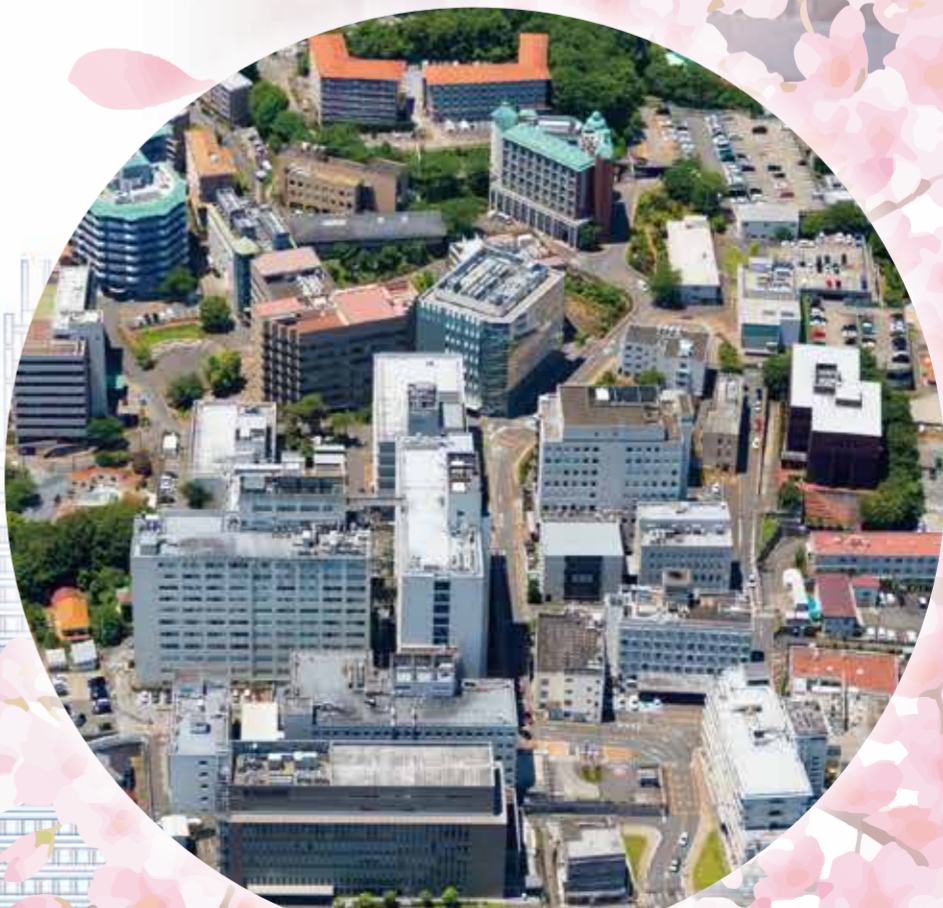
埼玉医科大学毛呂山キャンパス