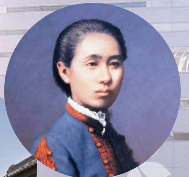
荻野吟子肖像画