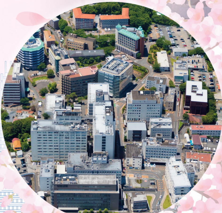
埼玉医科大学毛呂山キャンパス