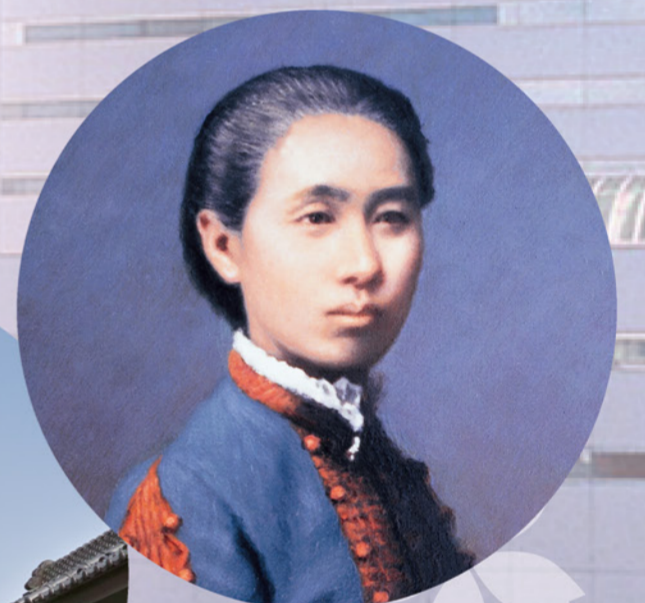
荻野吟子肖像画